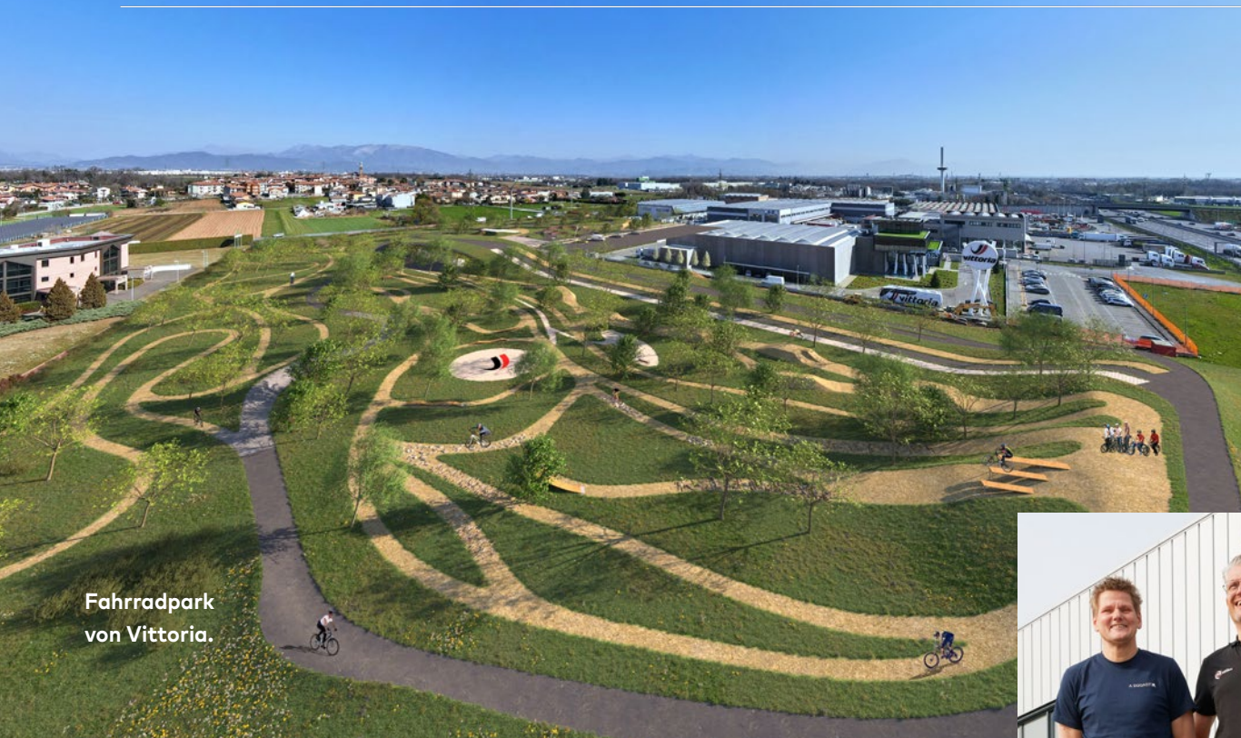
Fahrradpark von Vittoria.