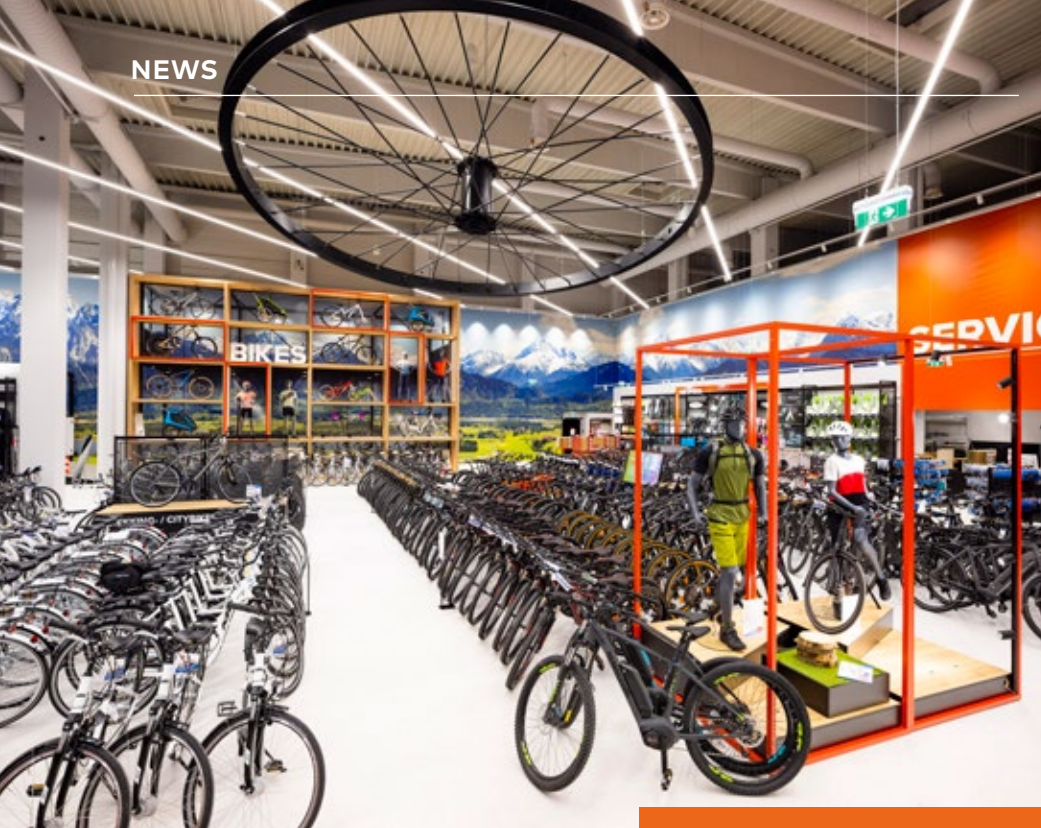
Hervis-Flagshipstore in Stadlau.