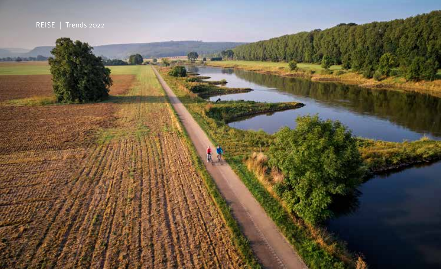
Der Weserradweg ist das beliebteste Rad-Reiseziel.