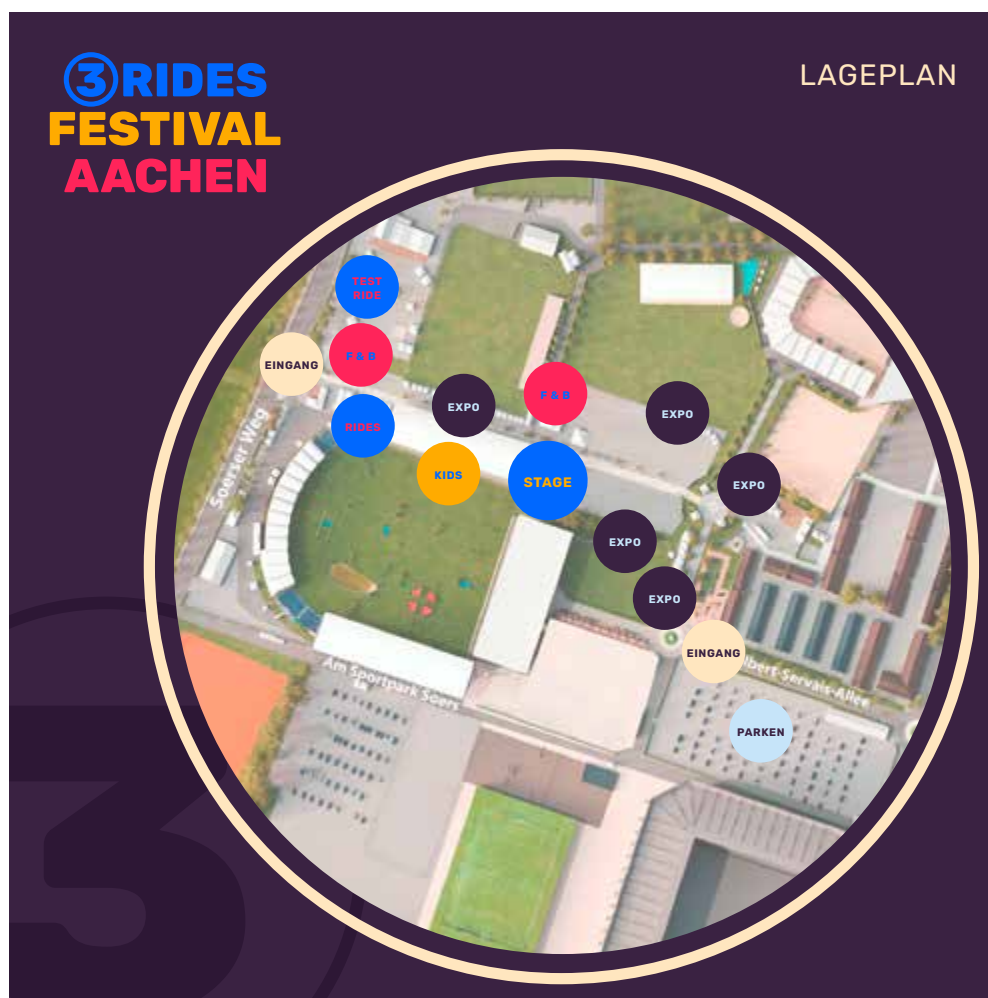
Vielfalt entdecken auf dem CHIO-Gelände in Aachen.

Nachhaltigkeit: Auf dem gesamten Festival-Gelände soll so umweltschonend und nachhaltig wie möglich gearbeitet werden.