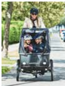
TITELFOTO Winther Bikes

PORTRÄT RÖHRL: THILO PARG/WIKIMEDIA COMMONS LIZENZ: CC BY-SA 3.0