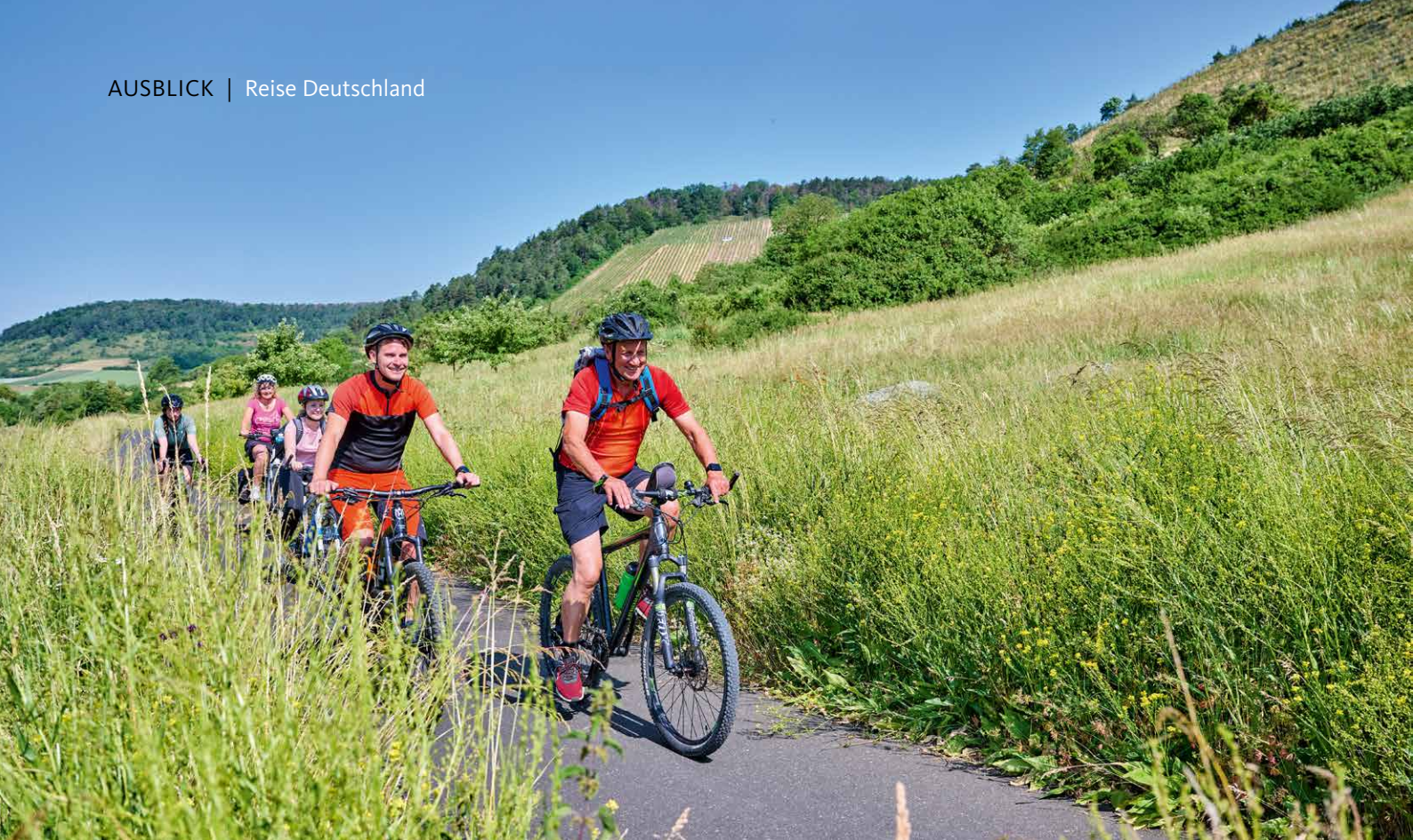
Die Rhön begeistert Radfahrer mit herrlicher Landschaft.