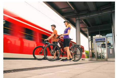
Links: Auf dem Tauber Altmühl Radweg bei Rothenburg o. d. Tauber. Mitte: Radtour durch die Kulmbacher Altstadt. Rechts: Entspannte Anreise mit dem ÖPNV nach Bad Staffelstein.