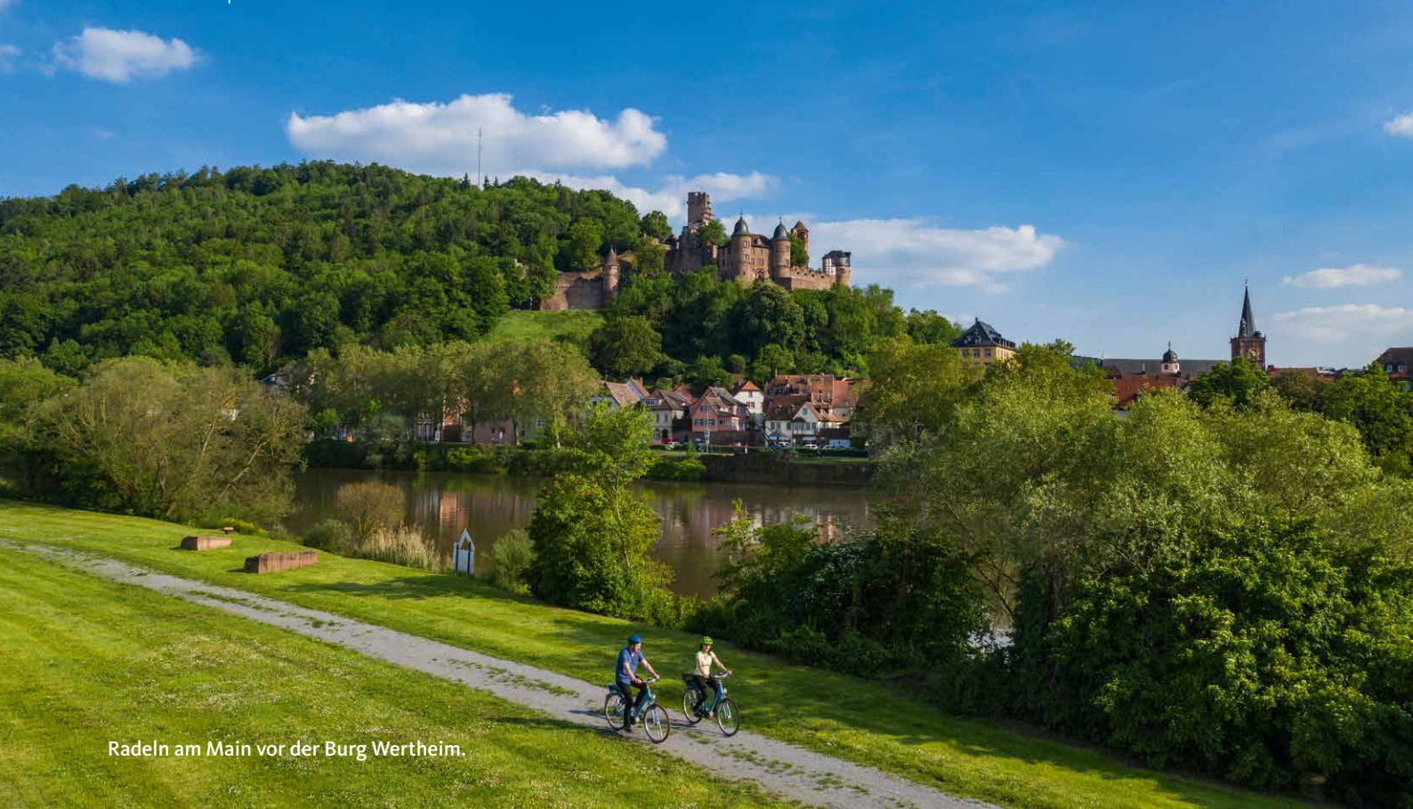
Radeln am Main vor der Burg Wertheim.