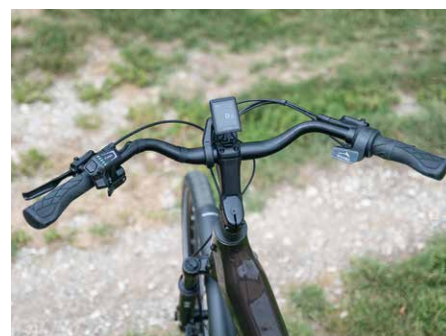
Blick ins aufgeräumte Cockpit mit Enviolo-Drehgriff und gekröpftem Lenker.

mance eine von zwei Antworten auf die steigende Nachfrage nach Bosch-basierten Modellen der Amsterdamer sein. Genau wie das Anfang April präsentierte Kompaktrad wird auch das mit großen 29-Zoll-Reifen rollende und für einige Wochen in unserer Redaktion stationierte AGO mit Boschs bis zu 75 Newtonmeter Drehmoment bereitstellendem Performance-Line-Aggregat angetrieben. Bei der ersten Inaugenscheinnahme ist sich unser Testfahrer-Team schnell einig: Tenways hat es abermals geschafft mit klarem Rahmendesign, durchweg sauberer Integration sämtlicher Kabel wie Züge und sehr un-