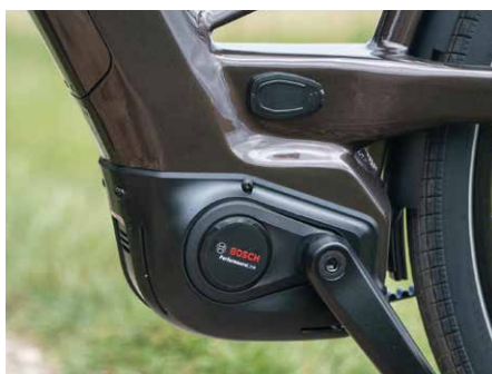
Boschs PL-Motor: Schön integriert und harmonische Power für Touren bereitstellend.

Vor fünf Jahren nach erfolgreicher Crowdfunding-Kampagne in den Niederlanden gegründet, hat sich Tenways seither rasant entwickelt und verfügt im Sommer 2026 über ein Netzwerk von mehr als 1500 Händlern in Europa. War die E-Bike-Marke bislang für schlanke Stadtflyter bekannt, soll das AGO Perfor-