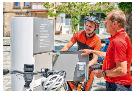
E-Bike-Ladestation in Hammelburg in der Rhön.