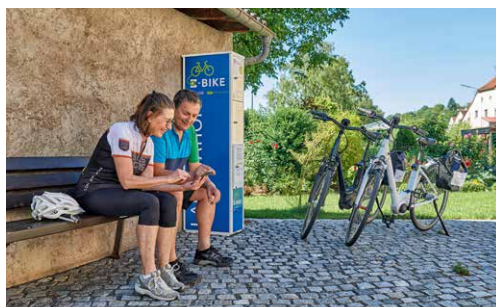
Mit dem E-Bike auf dem MainRadweg.

E in Fahrradurlaub in Franken beginnt ganz unkompliziert – etwa mit der Anreise per Bahn. Das passende E-Bike ist reserviert, die Ausrüstung steht bereit, und direkt vom Bahnhof aus startet das Tourenerebnis. Ob mehrtägiger Fernradweg oder Rundtour mit fester Unterkunft: Züge und Freizeitbusse mit Fahrradtransport sorgen für zusätzliche Flexibilität.