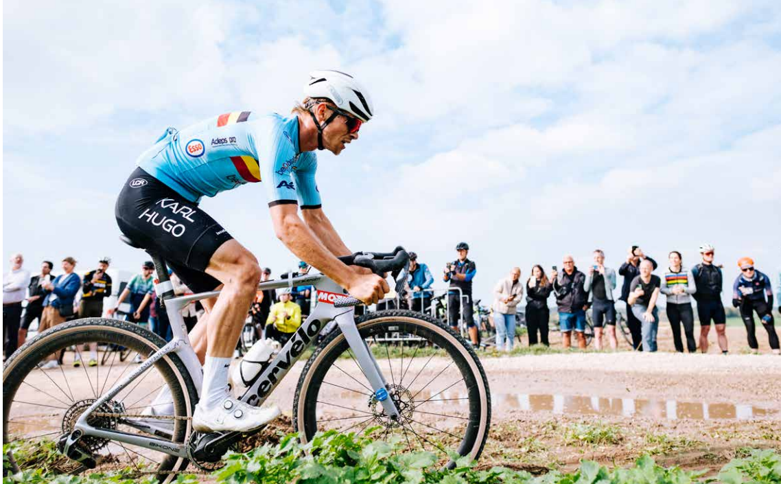
Der längste Ride beim 3Rides in Ostbelgien ist 200 km lang und führt durch die drei Länder Belgien, Deutschland und die Niederlande.