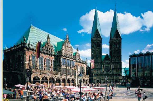
Marktplatz mit Rathaus und St. Petri Dom

lands gilt. In unmittelbarer Nachbarschaft eine Gasse voller Überraschungen, die berühmte Böttcherstraße; dann das Schnoorviertel mit Häusern aus dem 15. und 16. Jahrhundert, eine idyllische kleine Welt für sich; und wieder zum Leben erweckt die Weserpromenade Schlachte – quirliges Leben mit maritimem Ambiente –, wo schon vor 750 Jahren die Schiffe festmachten.